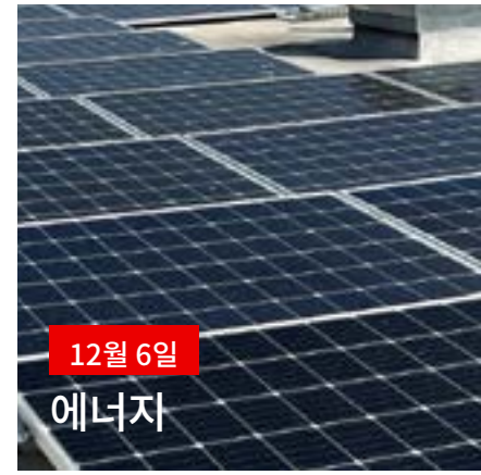
12월 6일 에너지