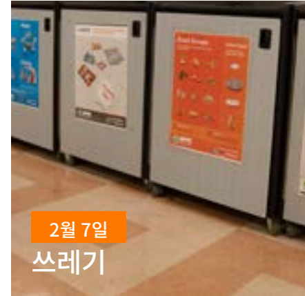
2월 7일 쓰레기