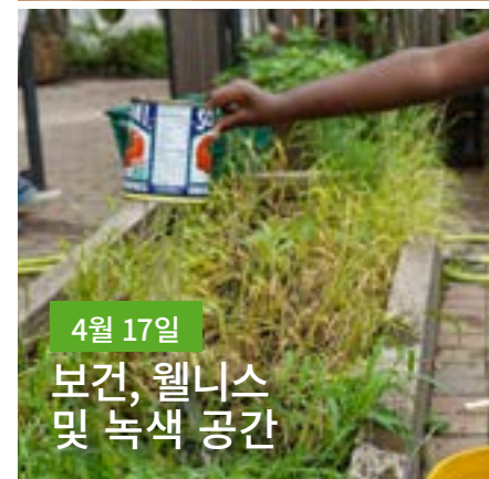
4월 17일 보건, 웰니스 및 녹색 공간